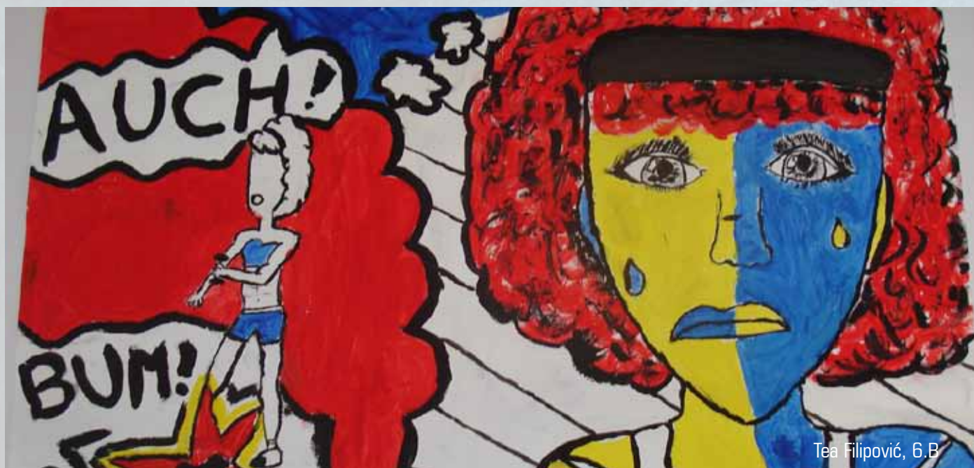
Tea Filipović, 6.B