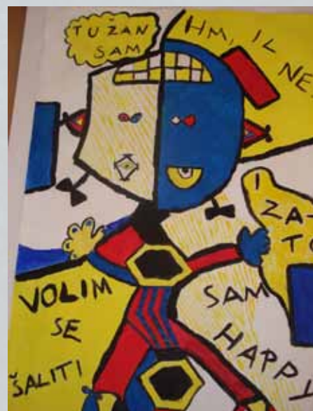
Anamarija Kovačec, 8.B