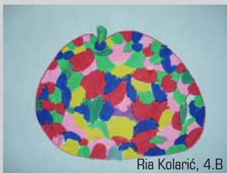
Ria Kolarić, 4.B