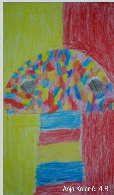
Anja Kolarić, 4.B