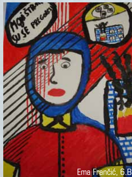
EMA FRANČIĆ, 6.B